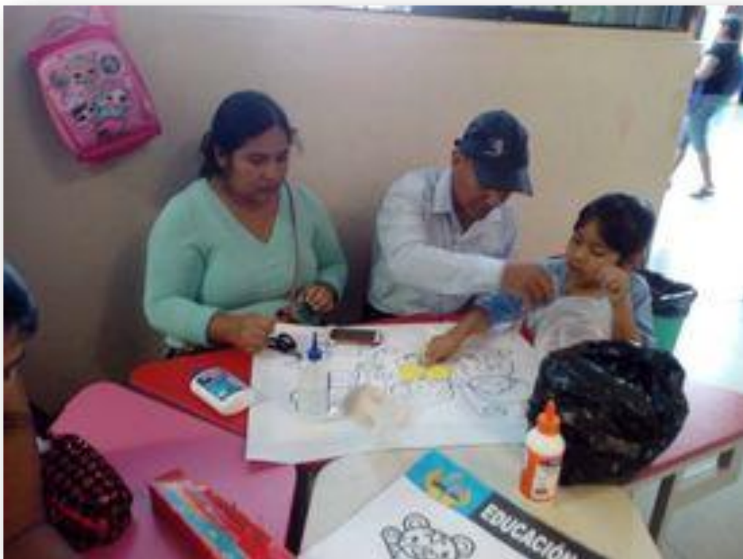
Actividades entre padres e hijos.