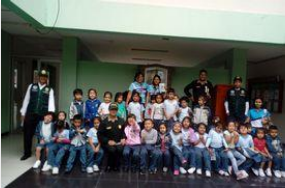
Salida a las instituciones, entregando a las autoridades los libros de esperanza.