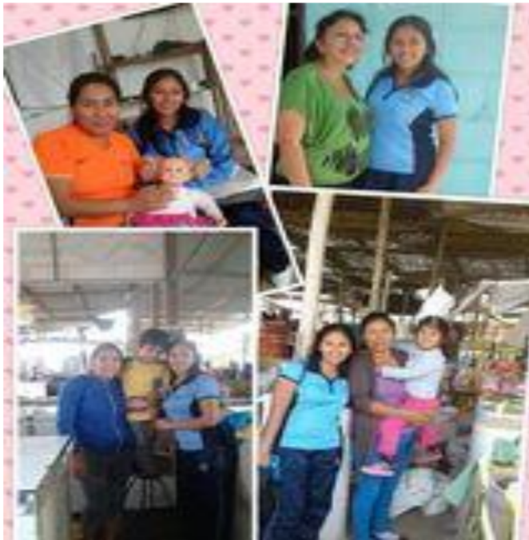
Visitación a los padres de familia.