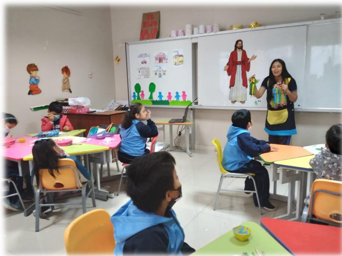
Relatando las historias bíblicas a los niños.