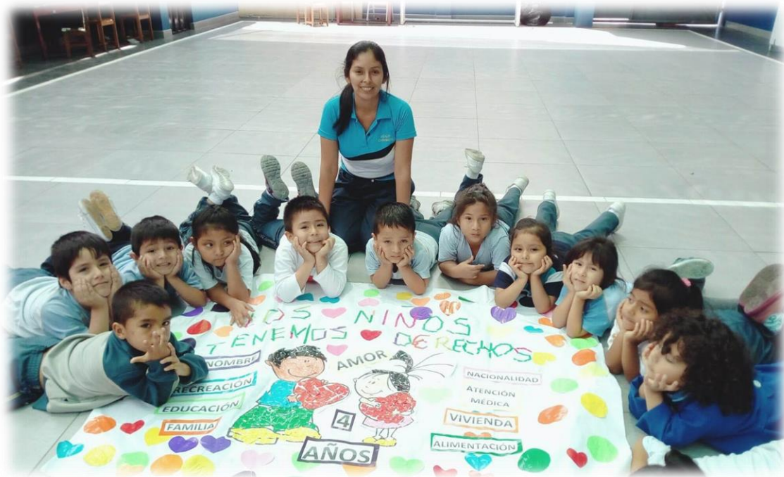
Trabajo en equipo fomentando el valor "EL RESPETO"