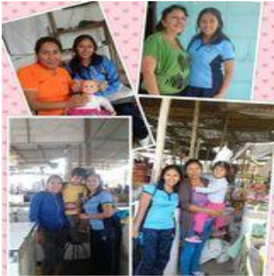
Visitación a los padres de familia.