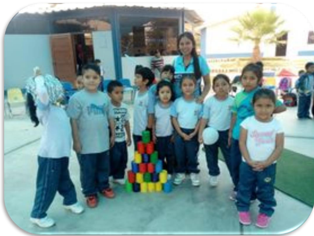
Actividades de las diferentes áreas.