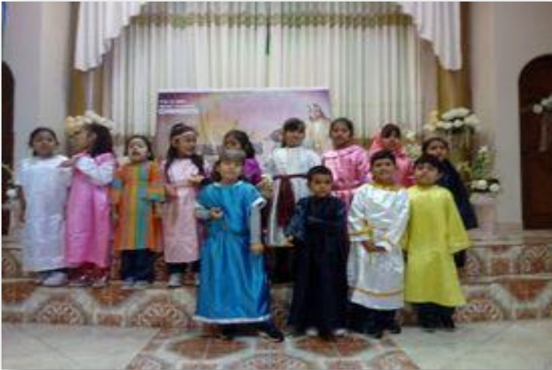
Dramatización de una historia bíblica