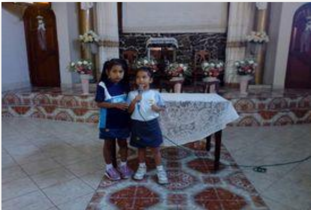
Participación de la sociedad de menores.