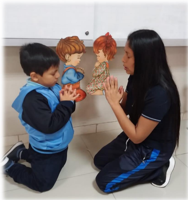
Momento de la oración intercesora.