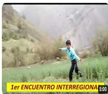
Aprendiendo Sin Barreras (video_01)

Link de los encuentros interregionales de las 5 regiones del Perú: Región Lima Metropolitana, Región Cajamarca, Región Ancash y Región Lambayeque.