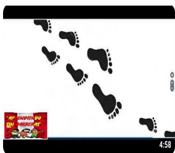
Aprendiendo Sin Barreras (video 2)