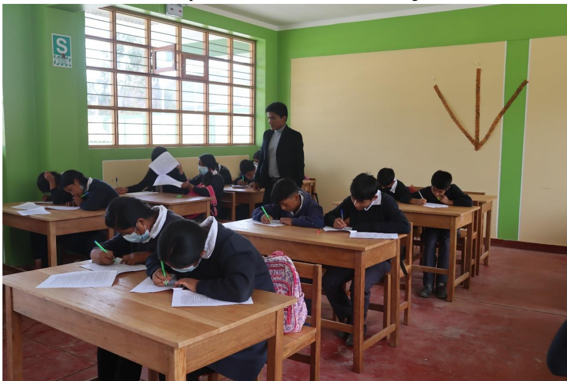
Monitoreo de la aplicación del Instrumento de investigación en la institución educativa José Gálvez