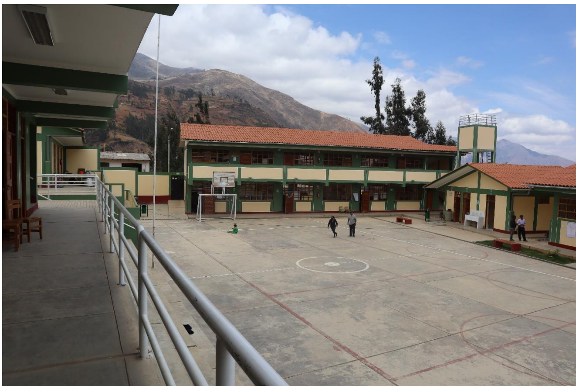
Fotografía del interior de la institución educativa José Galvez – Huanayó del distrito de Pueblo Libre.