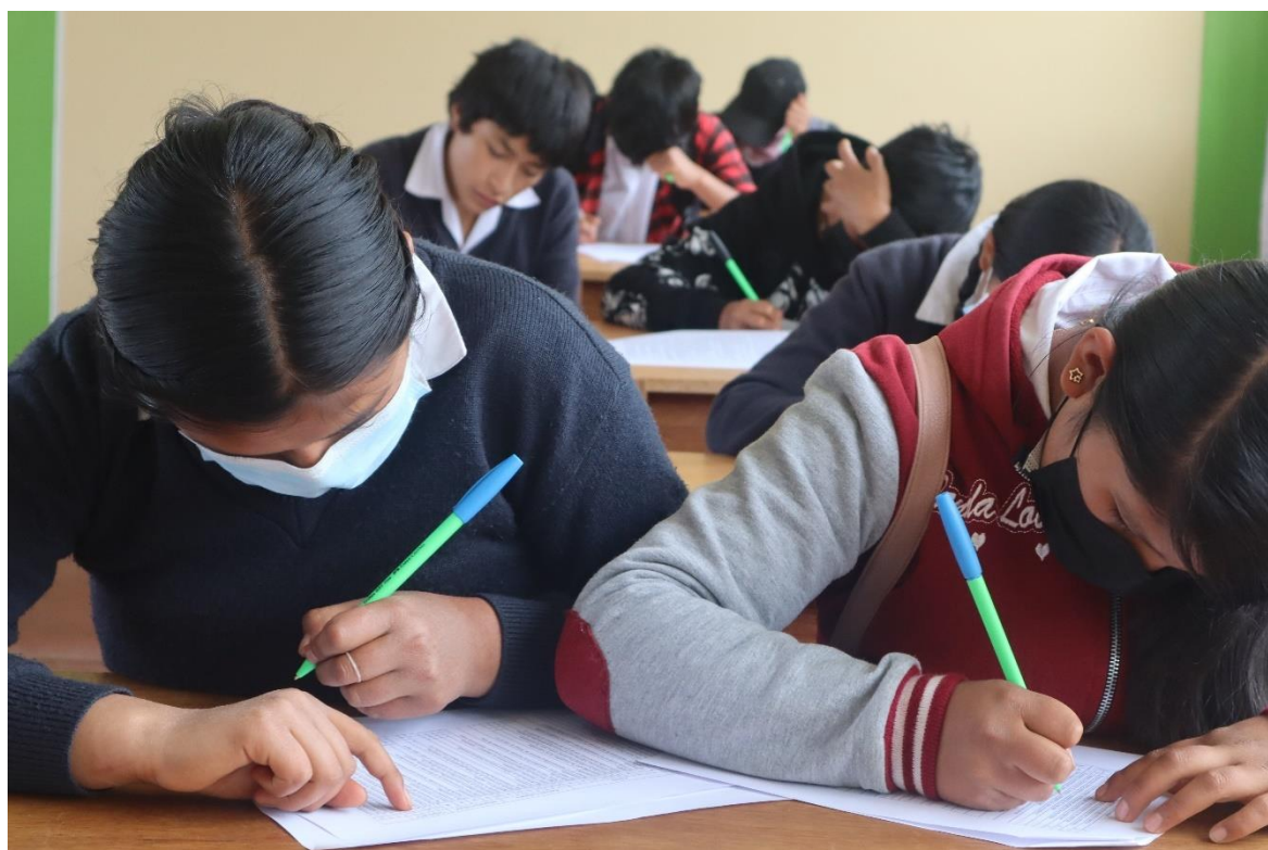
Los estudiantes de la Institución educativa resolviendo el instrumento de investigación.