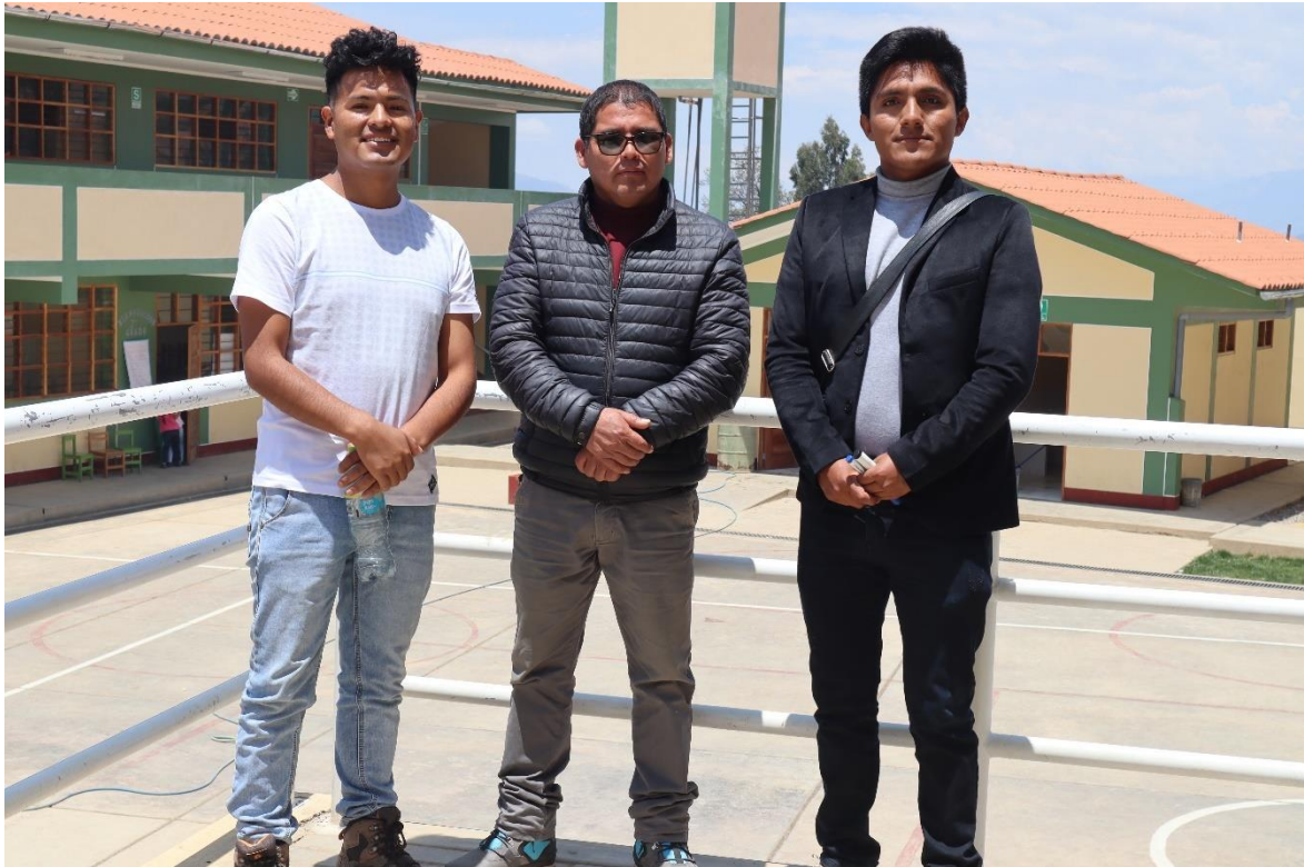
Fotografía con el director de la institución educativa José Gálvez en el frontis de la institución.