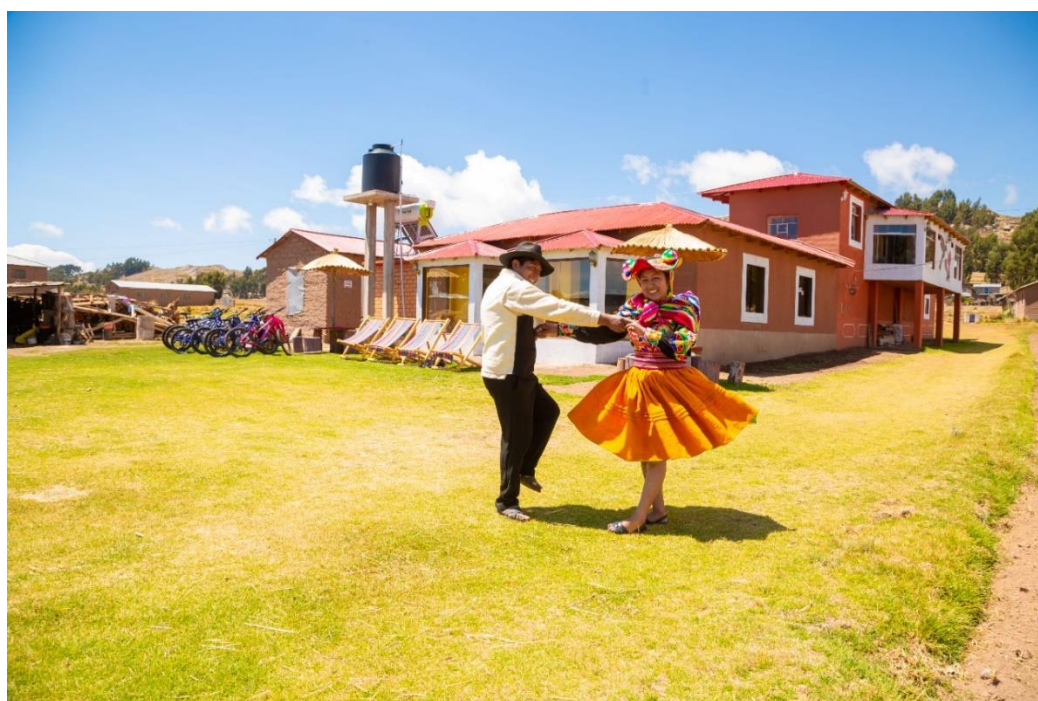
Figura 10 Kaswa danza tradicional y emblemática de Ccotos

Nota. Esta figura muestra la danza típica del centro poblado de Ccotos, la kaswa