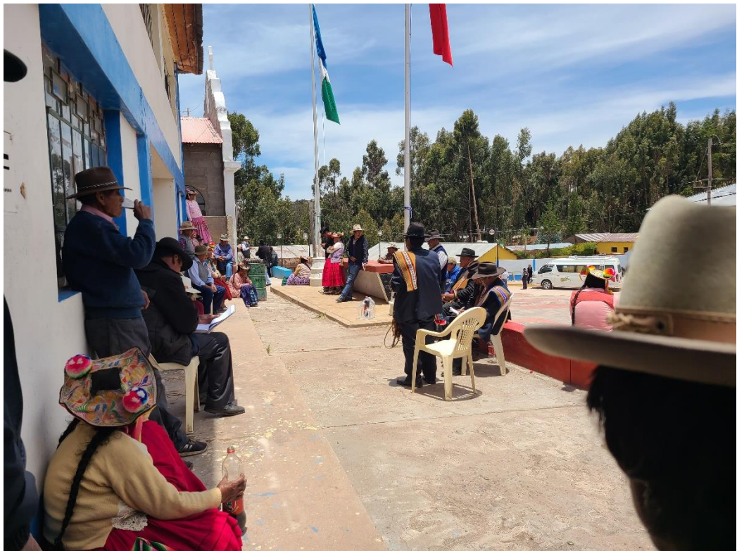
Figura 17 Reunión sectorial

Nota. En la figura se puede observar la reunión sectorial que se realiza dos veces por mes, donde se reúnen autoridades y población en cuando a la toma de decisiones del centro poblado de Ccotos.