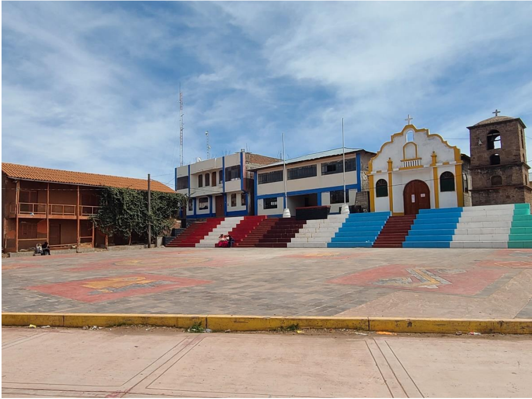
Figura 3 Plaza principal del centro poblado de Ccotos

Nota. En la figura se muestra la municipalidad, el local de reuniones y la capilla del centro poblado de Ccotos.