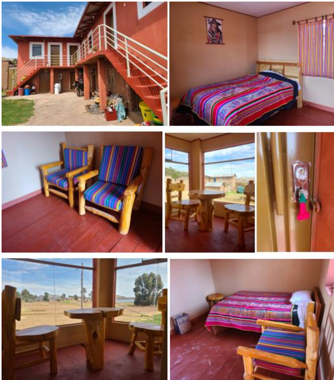
Figura 20 Características del hospedaje para turistas

Nota. En la figura se puede observar algunas de las características de los hospedajes que se ofrecen al turista, como es el dormitorio con vista panorámica al paisaje, y elementos elaborados de manera rústica que dan el toque hogareño.