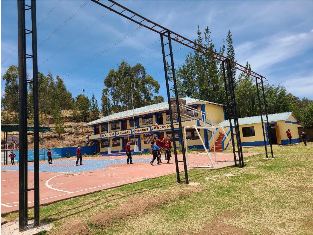
Figura 6 I.E.S. José Abelardo Quiñones

Sin embargo, el acceso a la educación puede ser limitada debido a su ubicación y condiciones geográficas, la población en su mayoría cuenta con educación secundaria completa.