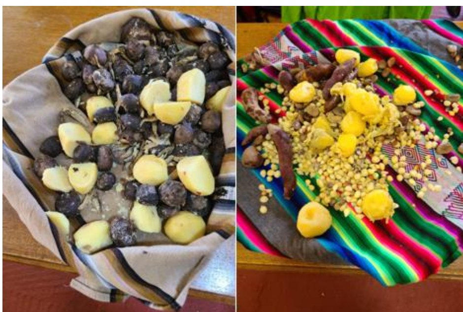
Figura 13 Fiambre tradicional

Nota. En esta figura se muestra el fiambre tradicional del centro poblado de Ccotos, el cual lleva a la papa como ingrediente recurrente.