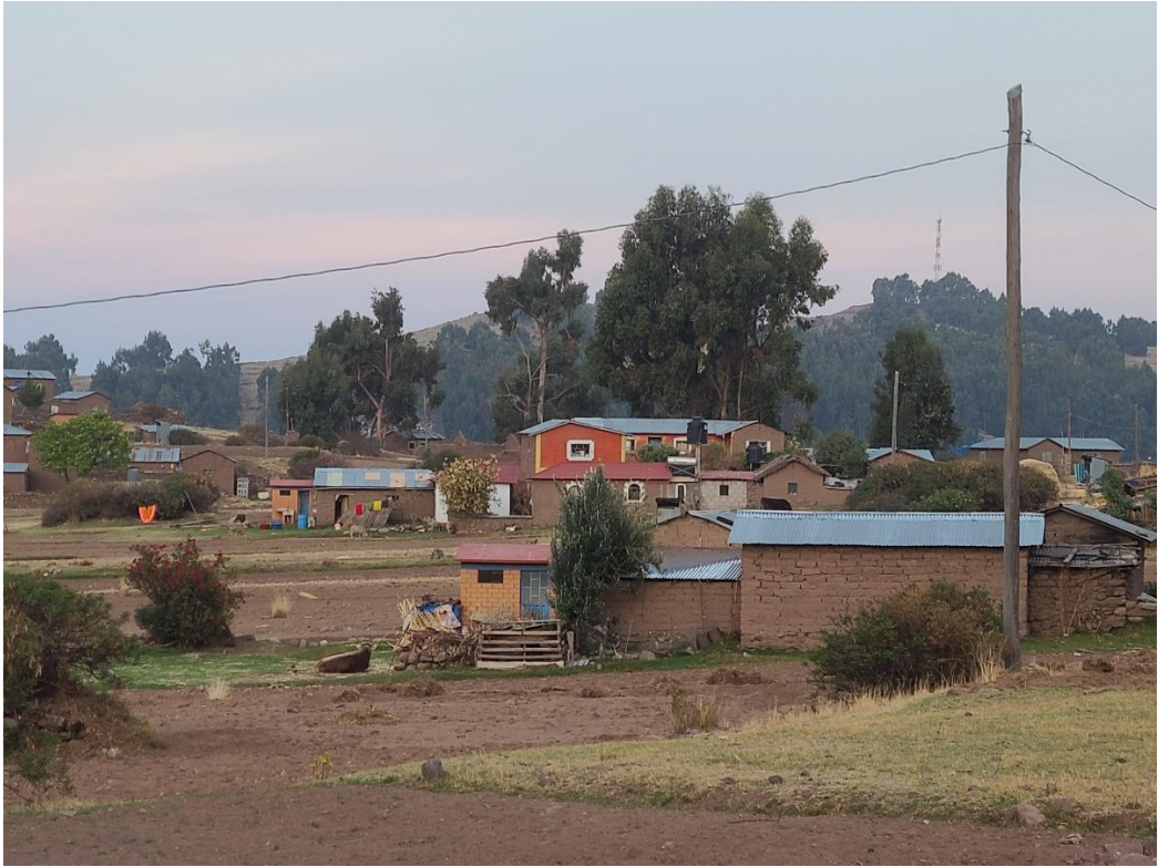
Figura 11 Viviendas del centro poblado de Ccotos

Nota. Las viviendas del centro poblado de Ccotos, todavía mantienen su construcción típica en base a piedra, adobe, barro y paja, pero también se puede observar construcciones en base a material noble.