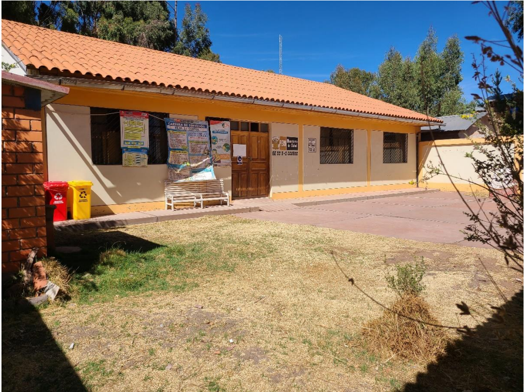
Figura 7 Establecimiento de salud nivel I Ccotos

Nota. Esta figura muestra el establecimiento de salud del centro poblado de Ccotos que tiene nivel I.