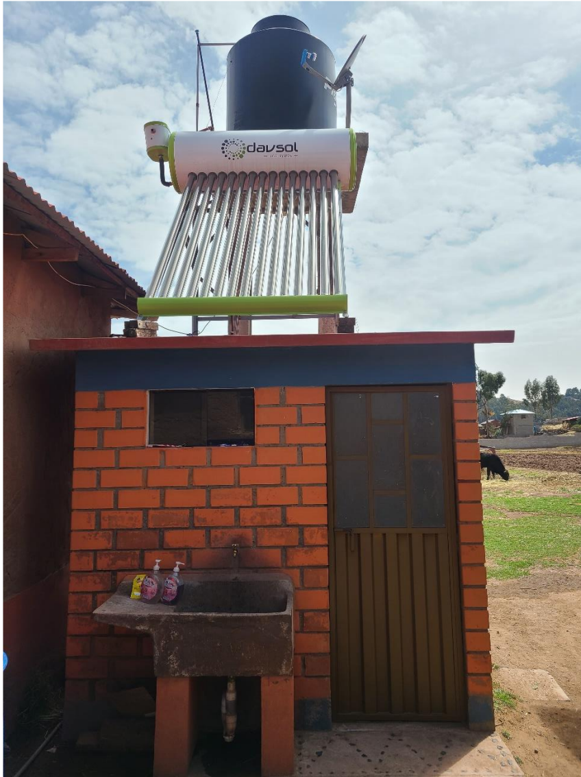
Figura 8 Modulo de saneamiento básico rural en Ccotos

Nota. Esta figura muestra el módulo de saneamiento básico rural que se construyó para cada una de las familias en el centro poblado de Ccotos.