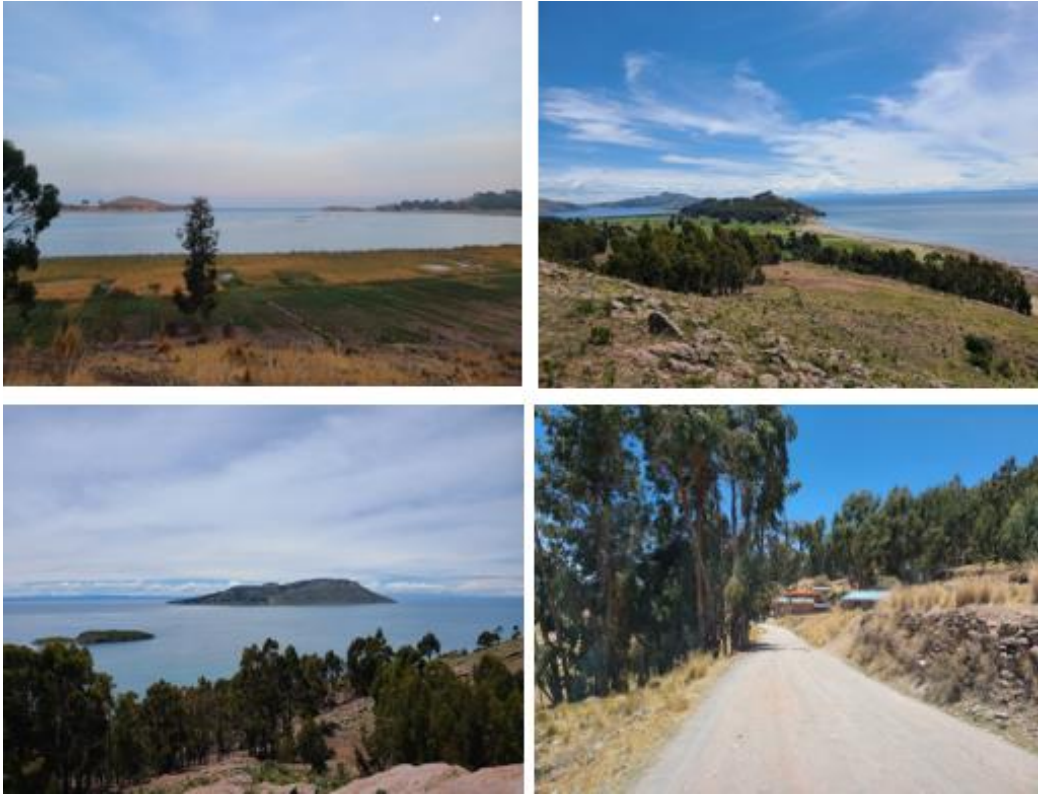
Figura 4 Paisajes del centro poblado de Cotos

Nota. En la figura se muestran algunos paisajes captados en nuestra visita del centro poblado de Cotos.