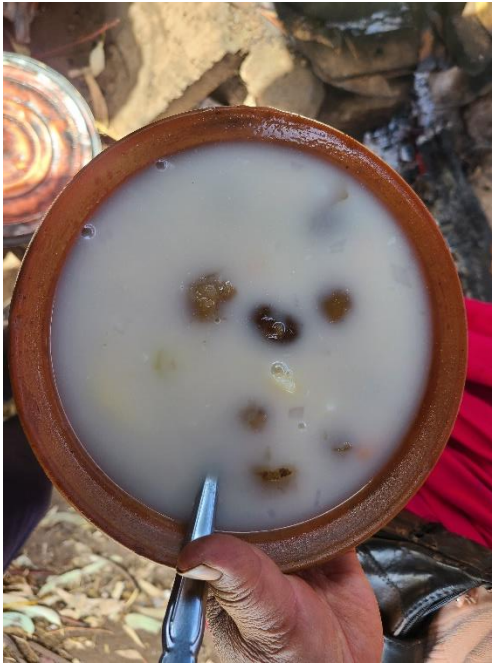
Figura 14 Phata Kaldo

Nota. En la figura se muestra el tradicional Phata Kaldo, que viene a ser uno de los platos tradicionales del centro poblado de Ccotos.