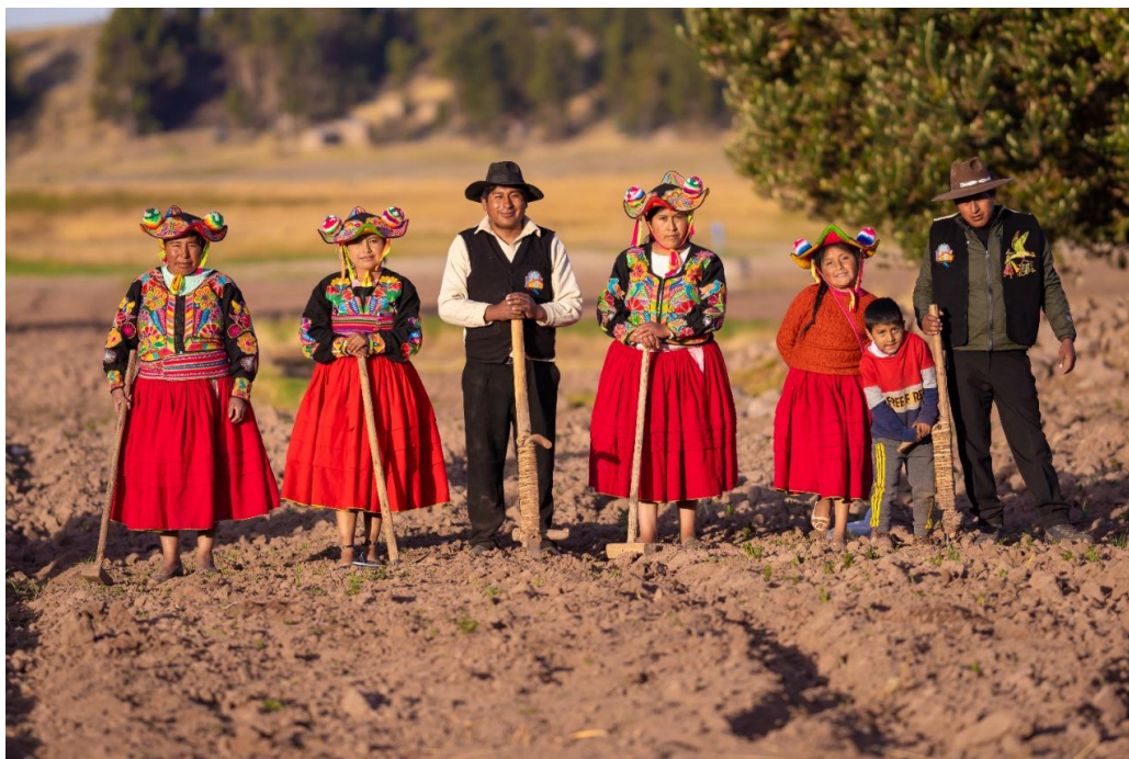
Figura 12 Traje típico del poblador de Ccotos

Nota. Esta figura muestra el traje típico del centro poblado de Ccotos, fue extraída del Facebook oficial de Qoñi Wasi Ccotos Capachica. https://www.facebook.com/photo.php?fbid=3819002534987236&set=pb.100006325815410.-2207520000&type=3