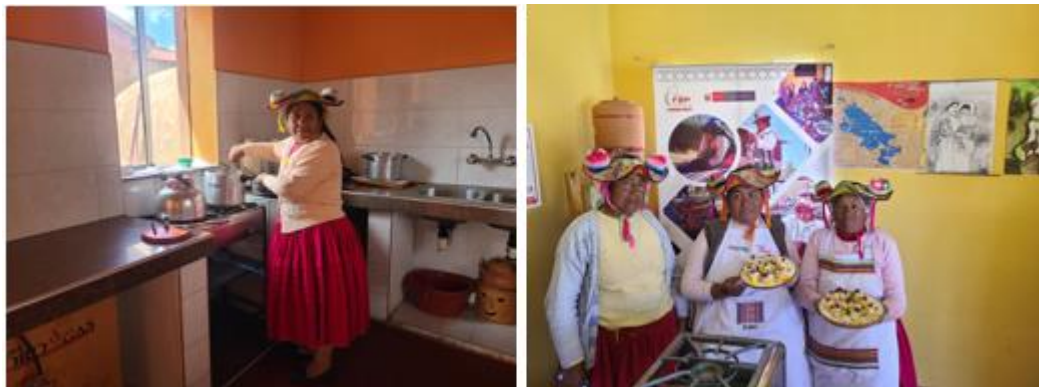
Preparación de alimentos para turistas

Nota. En la figura se muestra la preparación de alimentos para turistas en base a quinua.