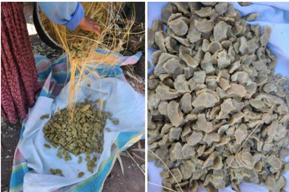
Figura 15 Elaboración del kispño de quinua

Nota. En la figura se muestra la elaboración del kispño, que viene a ser uno de los platos tradicionales del centro poblado de Ccotos.