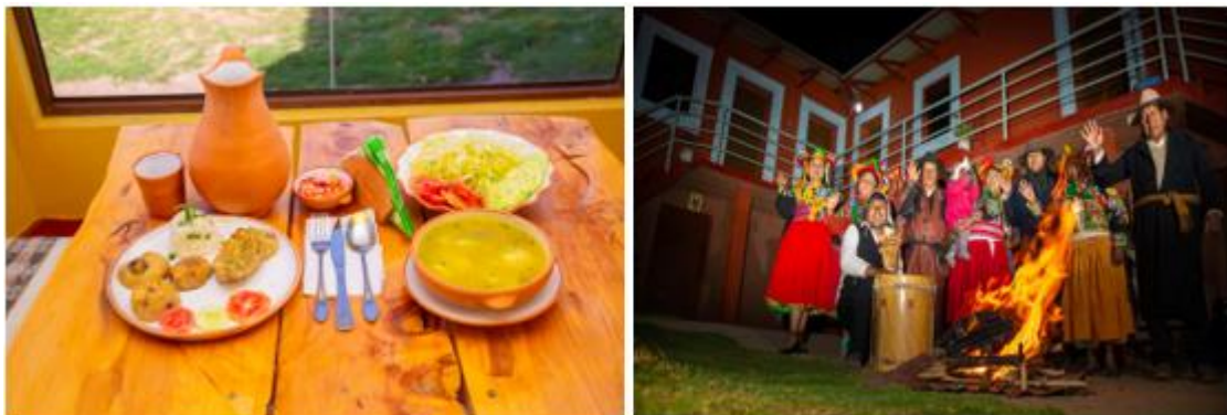
Figura 21 Gastronomía y presentaciones artísticas de Ccotos

Nota. En la figura se puede apreciar el almuerzo que se brinda a los turistas y las presentaciones artísticas local en el hospedaje.