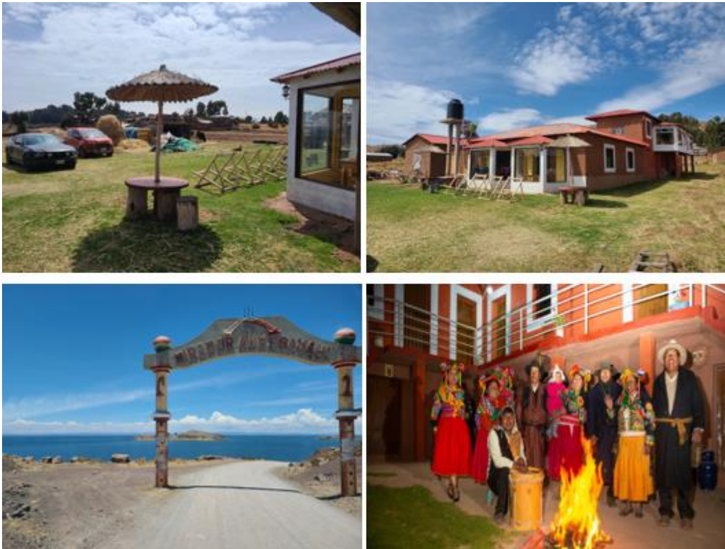
Figura 18 Atractivos naturales y culturales

Nota. En la figura se puede observar algunos atractivos naturales y culturales del centro poblado de Ccotos.