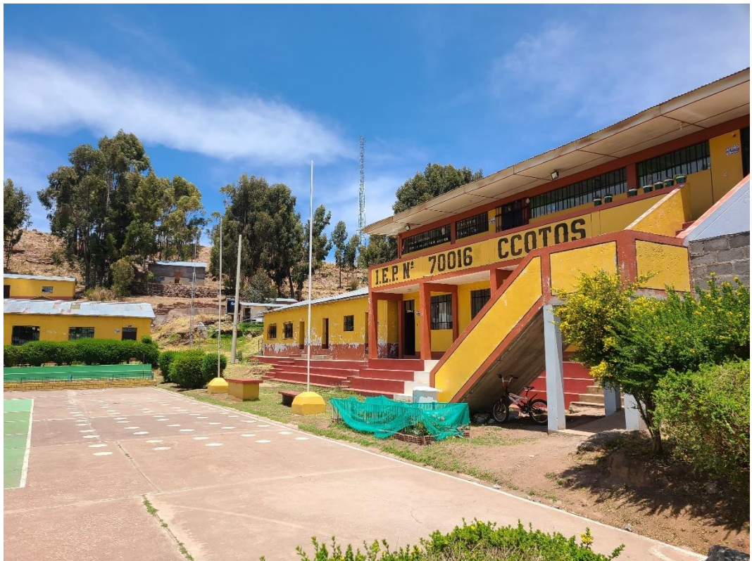
Tabla 6 Institución de educación secundaria de Ccotos