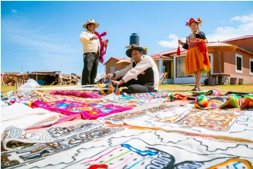
Figura 9 Textilería en Ccotos

Nota. Esta figura muestra la textilería del centro poblado de Ccotos, fue extraída del Facebook oficial de Qoñi Wasi Ccotos Capachica. https://www.facebook.com/photo.php?fbid=3819002471653909&set=pb.100006325815410.-2207520000&type=3